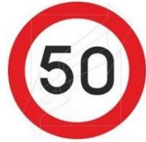
Ρυθμιστική πινακίδα P32