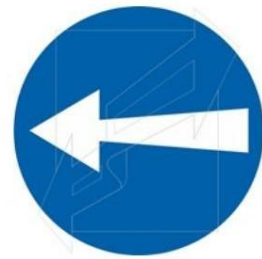
Ρυθμιστική πινακίδα P47