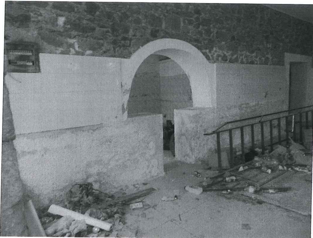
ΦΩΤΟ 14 ΕΣΩΤΕΡΙΚΑ ΤΟΥ ΚΤΗΡΙΟΥ -ΙΣΟΓΕΙΟ