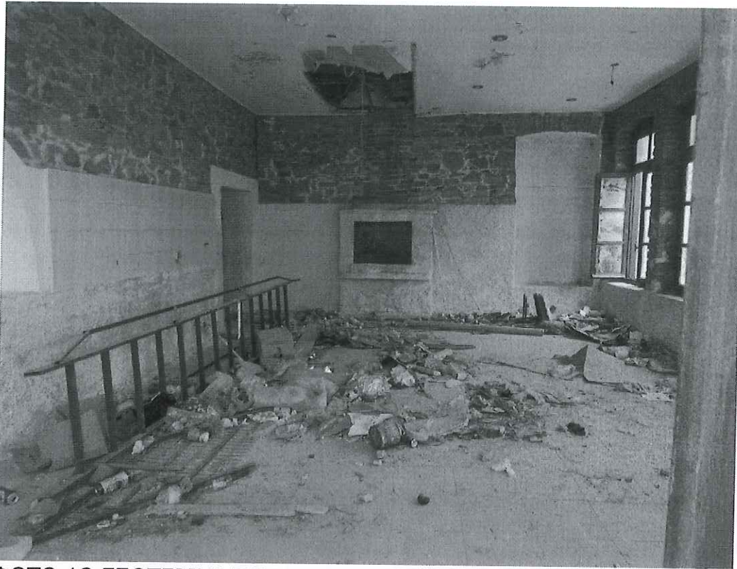
ΦΩΤΟ 13 ΕΣΩΤΕΡΙΚΑ ΤΟΥ ΚΤΗΡΙΟΥ -ΙΣΟΓΕΙΟ