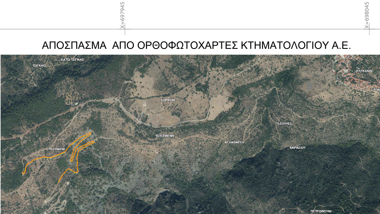
ΘΕΣΗ ΑΓΡΟΤΙΚΗΣ ΟΔΟΥ